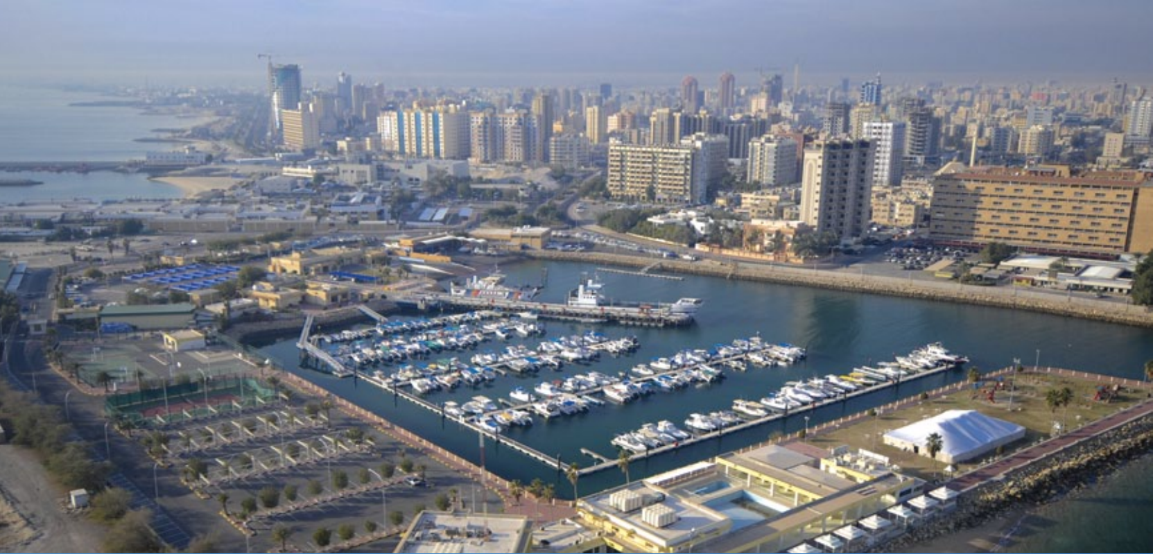
Kuwait City مدينة الكويت